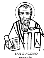
SAN GIACOMO apostolo

Via Mazzini, 48 – 48022 LUGO (RA) Telefono e fax 0545 23213 Cell. 347 922 2 922 redazione@sangiacomolugo.info